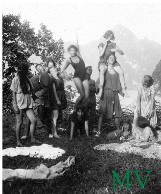
Initiales , n° 4, septembre 2014, 15 euros, ENSBA 8 bis quai St Vincent 69001 Lyon www.ensba-lyon.fr/revueinitiales