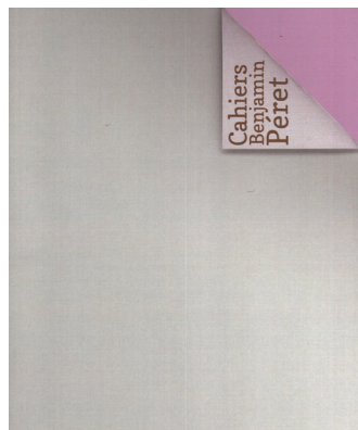
Cahiers Benjamin Péret , n° 3, 2014, Amis de Benjamin Péret 50 rue de la Charité 69002 Lyon www.benjamin-peret.org